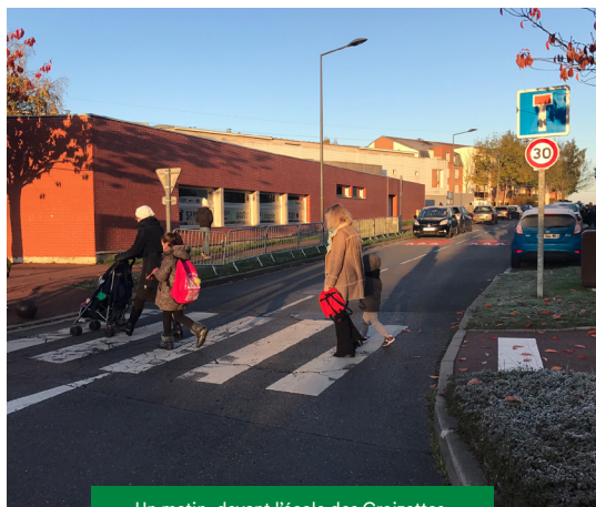
Un matin, devant l'école des Croizettes.

L'année 2017 aura également été particulièrement riche en aménagements de notre environnement immédiat. Au village, des essais grandeur nature et la consultation attentive des riverains ont permis de trouver des solutions efficaces pour réduire le passage de transit et apaiser la circulation rue Raymond Berrivin. Les expérimentations d'aménagements sont toujours en cours pour une mise en service au premier trimestre 2018. Dans le même état d'esprit, les habitants de la rue Vieille Saint-Martin ont été de nouveau concertés le 7 novembre dernier. Ils ont ainsi décidé et validé avec les élus les dispositifs à installer pour réduire la vitesse dans cette rue.