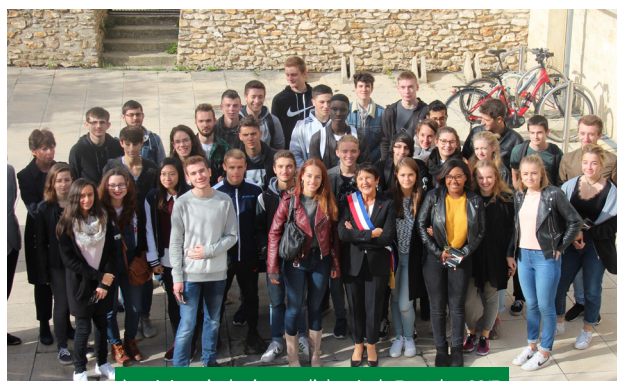
La cérémonie des jeunes diplômés du 7 octobre 2017.